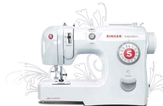
MODEL 4228 MODELO 4228